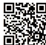
申し込み用QRコード