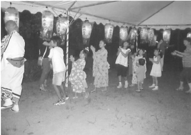
★大野台一丁目の地藏盆 どの子も笑顔で、はつらつと 歌に、踊りに、余興に… 狭き庭でも、楽しい祭り