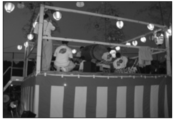
★大野地区の夏祭り やぐらの上で、日ごろ鍛え た太鼓の音が、夏の夜空に響 いていました。古式豊かな夏 祭り