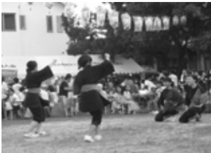
★狭山ニュータウンの夏祭り 出店は長蛇の列、売り切れ続出 祭りは和太鼓に始まり、大道芸、 演舞…締めは、老いも若きも一つ の輪になつての盆踊り。