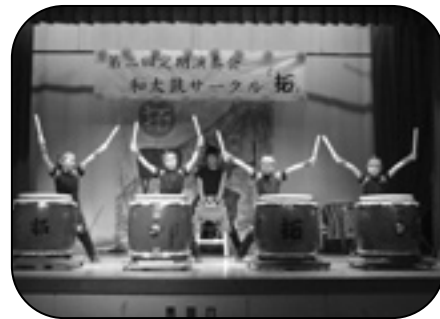
和太鼓サークル「拓」 定期演奏会の風景

27年前に、堺市の教員仲間と太鼓サークルを立ち上げ、堺の文化を切り拓くサークルにという願いこめて「拓(ひろく)」と命名。地方に伝わる伝統的な和太鼓の曲を学び、その心を伝えることができるようにと研鑽を続けておられます。