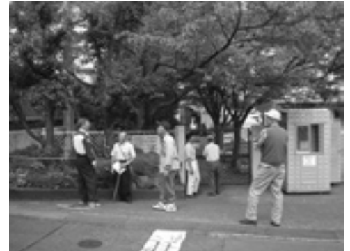
現地を歩いて見て廻る部会メンバー