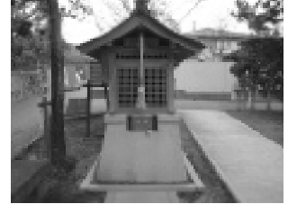
延命地蔵 (大野台第1集会所)

長寿地蔵の建立時期は、昭和 53 年 3 月に狭山ニュータウン長寿会の会員が中心となり建立されました。