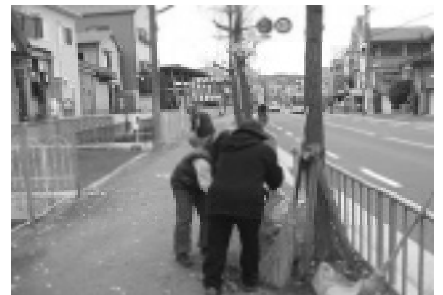
写真上 舞い散るイチョウ(の葉)を掻き集める清掃活動の様子