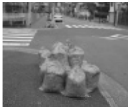
写真下 集められたイチョウの袋詰め

▼昨年十二月六日、校区一斉清掃の呼びかけに多くの皆さんが駆けつけ、幹線街路の歩道、近くの公園などの清掃活動を行いました。▼まちを彩るいちよう並木、風に吹かれて舞い落ち歩道は黄色いじゅうたんの様。かき集めたそのとき突風が、負けじとまた掻き集める・・・▼校区一斉清掃に駆けつけた皆さん、本当にお疲れ様でした。