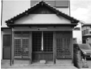
大師堂 (茱萸木4丁目)

穴地蔵という言葉どおり、目、鼻等穴という穴の病気の願いや、子宝が授かると古くから言い伝えがあります。昔から、遠方の人たちもここを訪れています。機会があれば、一度いかれてみてはいかがでしょうか。