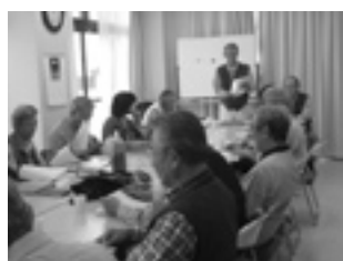
写真（拡大）理事会 （事業案の検討）