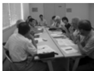
写真 熱心に討議する部 会員の皆さん