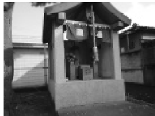
長寿地蔵 (西山台第4公園)

大師堂は大正 15 年に建立され、ひとつの堂に、3つの地蔵があることは珍しいものだそうです。今の大師堂は、平成 14 年に交通事故により倒壊し、現在は、ほぼ同型の堂が再建されました。正面左側には、「夜なき地蔵」「大峯行者」右側には、「子安地蔵」「一願地蔵」があります。