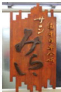
サロンみらいの看板