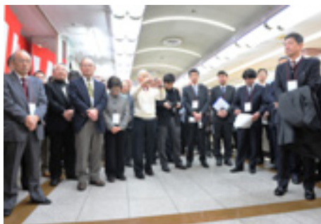
参列された来賓の方々