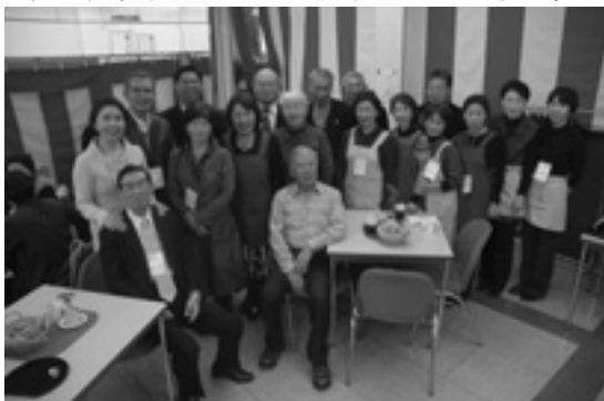
ボランティアの面々