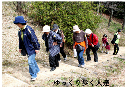
ゆっくり歩く人達