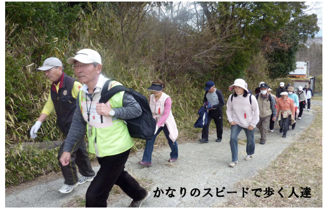
かなりのスピードで歩く人達