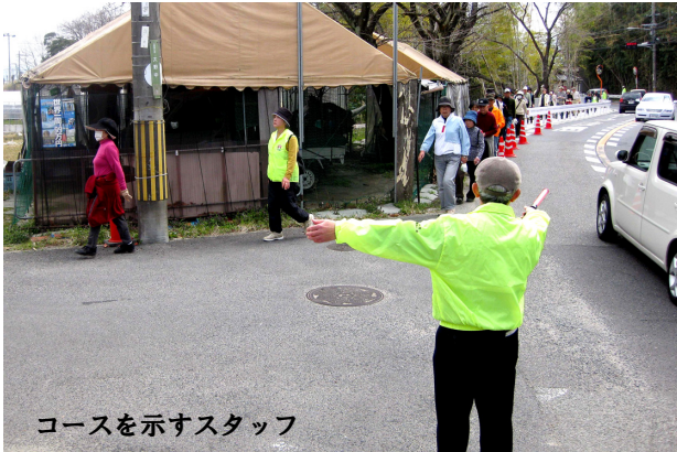
コースを示すスタッフ