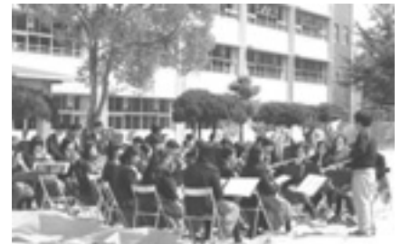
南中プラスバンド