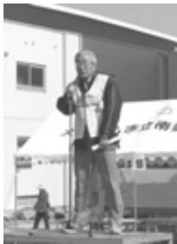
坂上部会長の挨拶

ウォーキングへ参加の皆さん、15 自治会の協力していただいた皆さん有難うございました。