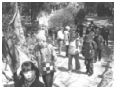
あまの街道を歩く