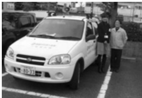
市職員とボランティア

23年11月から、南中円卓エリアを毎週月曜日と金曜日、子どもの下校時に合わせ、マイカーで防犯パトロール(走行約20km)を実施してきました。24年2月からは、毎週月曜日には、市役所所有の青色防犯パトロール車を市の職員が運転し、円卓メンバーが同乗する形で、協働によるパトロールを始めました。このような市と市民の協働作業を広げていきたいと思っています。