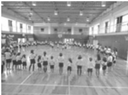
一年生と六年生の交流

3つ目は『家庭学習の習慣化』です。保護者と連携しながら、家庭での学習内容や、学習の環境を整え、家庭学習の習慣化に取り組んでいきます。