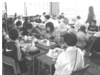
地域の人たちと給食をとる

南第三小学校は、今後いつまでもこの地に建ち、地域の皆さまに温かく見守られ、もっともっと素敵な学校になっていくような気がいたします。ご支援をよろしくお願いいたします。