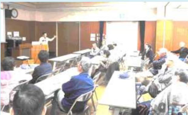
NPO法人についての説明会の様子(1)

南中円卓会議 NPO 法人化の重要項目の一つ、自治会が正会員となることを各自治会で了解してもらうために、3月27日と3月31日の2回、地域の方を対象に南中円卓会議 NPO 法人化の説明会を実施しました。