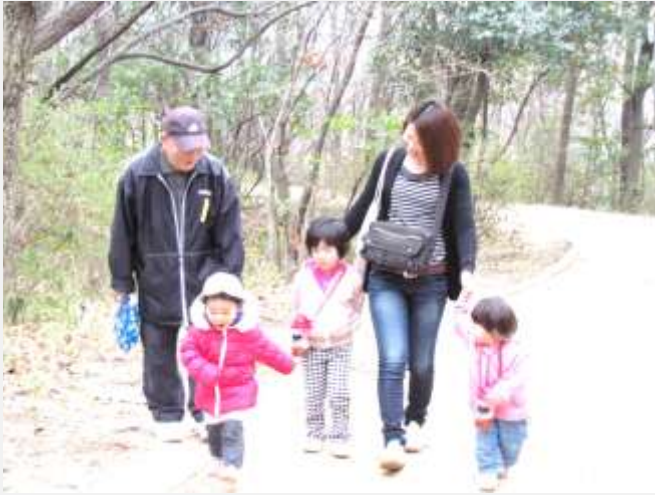
陶器山を歩く参加者