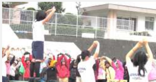
南中学校生徒のリードで準備体操をする