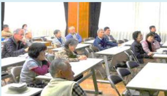
NPO 法人についての説明会の様子(2)

これらの結果として、自治会との役割分担を明確にし、「地域住民によるまちづくり」の促進と「円卓会議の活動を維持、継続し定着させる」ことができるようになります。