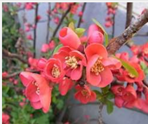
季節の花（かんぼけ）

南中円卓会議の活動 人と人をつなげる：コミュニティカフェ まちかどに花を：花いっぱい運動 気軽に参加：げんきウォーキング いつまでも元気に：健康講座・元気クラブ 安全・安心：防犯パトロール