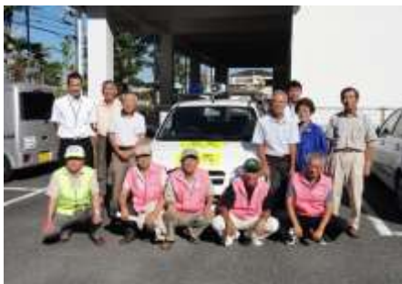
引き渡し式に参加した市と南中円卓会議の皆さん

※青色防犯パトロール活動とは、大阪府警察本部から適格団体の証明を受け、専ら地域の防犯のために、青色回転灯を装備した自動車を使用し、行う自主防犯パトロール活動をいいます。