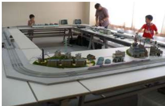
鉄道ジオラマに興じる子どもたち