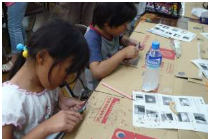
慣れない小刀で鉛筆を削る