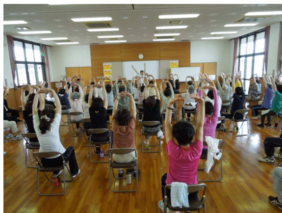
次回の募集は、平成26年2月です。募集の案内をお見逃しなく。

元気クラブをいつまでも続けられるよう円卓会議のメンバーも努力を続けますが、皆様のご協力が大きな力となります。