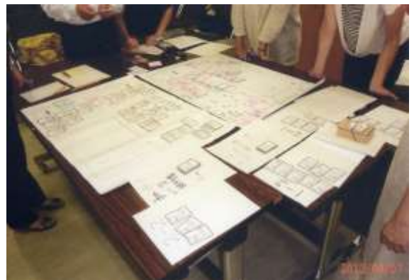
避難所運営図上訓練 (HUG) 研修会の様子