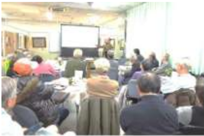
ミニ講演会の様子

*「サロンみらい」には、南中円卓会議の事務所と「円卓カフェみらい」、を併設しています。