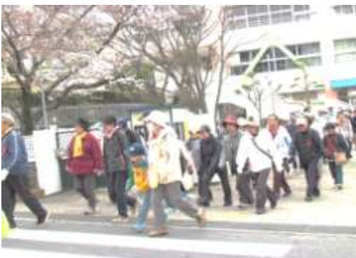
校門を出る参加者

「いろんな人と話し合えて良かった。楽しかった。」などの感想をいただいています。第4回目は、平成26年3月29日（土）を予定しています。