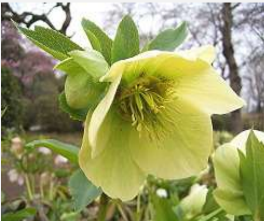
季節の花（クリスマスローズ）