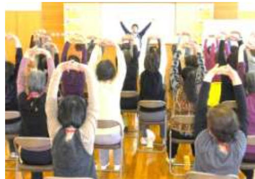
元気に体操をする

7名の参加で「サロンみらい」で始めたのですが、今や人数制限をして80名もの参加になっています。