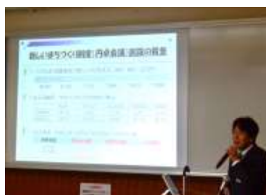
大阪狭山市政策調整室 東理事