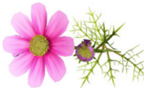
季節の花（コスモス）