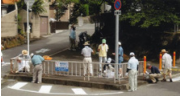
作業する公団住宅のボランティア

7月12日(土)、南第三小学校区地域防犯ステーションの支援活動として、公団狭山住宅の給水塔下の通学路の錆びた鉄柵の塗装を行いました。