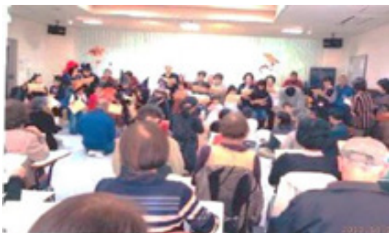
皆で歌おう(昨年度の写真)

多数の趣味の作品展示、折紙・遊び・喫茶コーナーの設置、そして盛りだくさんの演芸の披露です。