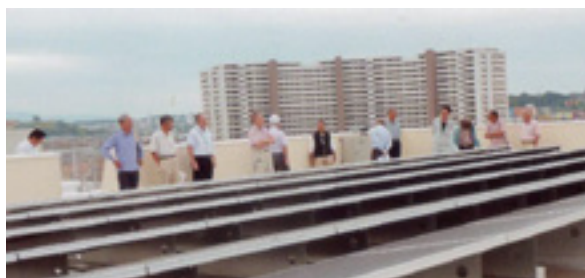
市庁舎屋上に設置されている太陽光発電装置

黒山警察署、市との協働による自転車へのひたたくり防止カバー取付けキャンペーンを11月と来年3月の2回、スーパーコノミヤ及びマツゲン前で実施します。