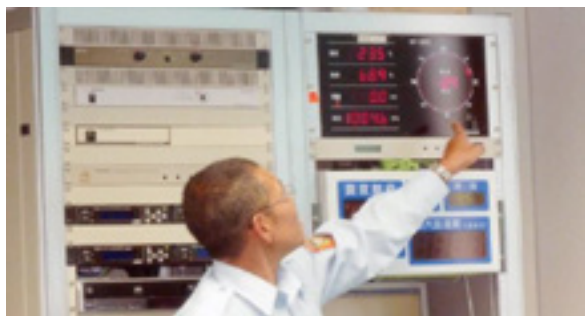
地震計を説明する消防署員