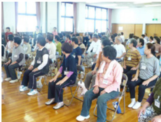
首の運動中の受講者

現在は、毎週火曜日の午前 10 時から消防本部狭山ニュータウン出張所で行っています。