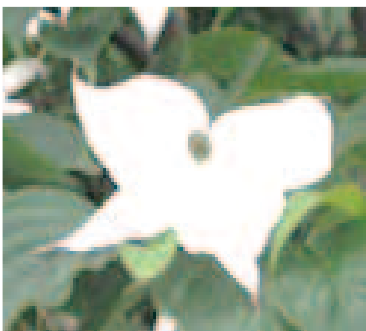
季節の花（やまぼうし）