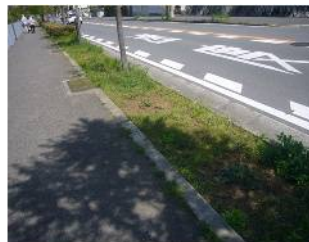
植えて間もない（4月）