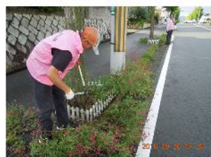
チェリーセイジの剪定