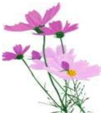
季節の花（コスモス）