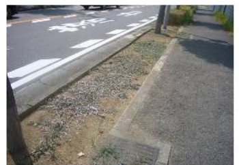
裏返って猛暑に耐える（8月）