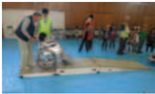
車椅子の取り扱い