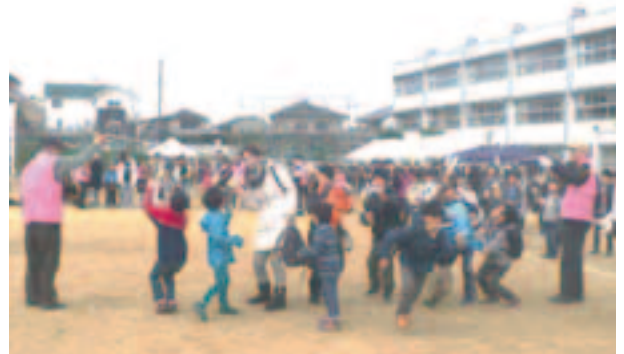
小学生たちの挑戦。手を使っている子はいない?

今回は、予定していました防災訓練を実施できなかったのですが、「いざ」という時には中学生の力がが必要です。今後も、中学生の防災訓練への参加を促したく思っています。