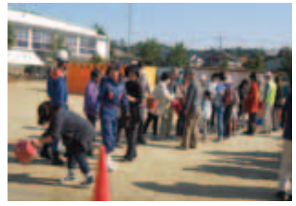
初期消火（バケツリレー）