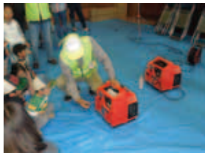
発電機の取り扱い