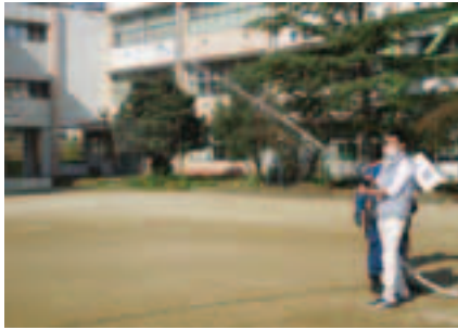
消火栓からの消化