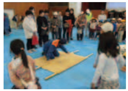
簡易担架の作り方