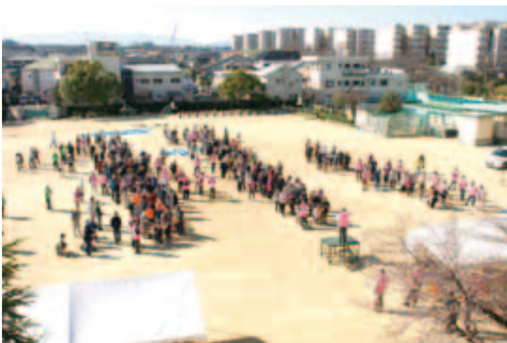
昨年までのウォーキングの様子