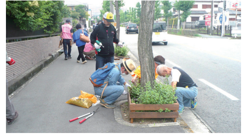
よみがえった多年草

犬猫が入らないように市の了解のもと簡単な柵の設置を行いました。その後、雨も降り本来の姿によみがえりました。