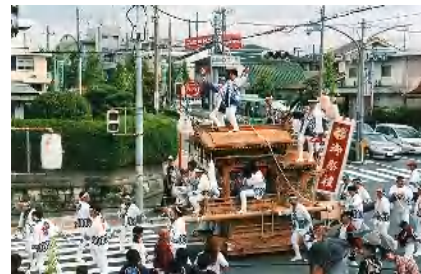
昨年の大野のだんじり