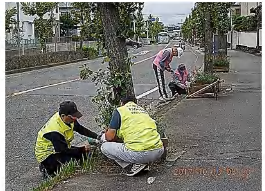
新しい柵の設置作業