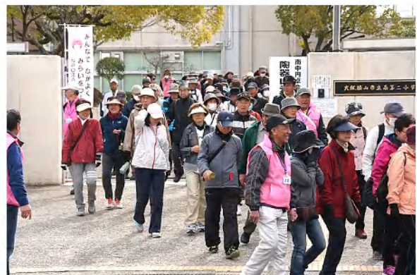
昨年のウォーキング