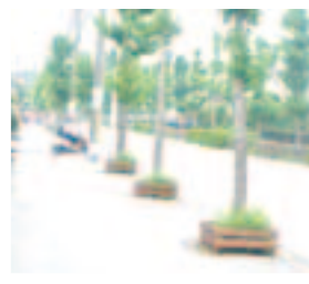
29年度の成果：柵の設置