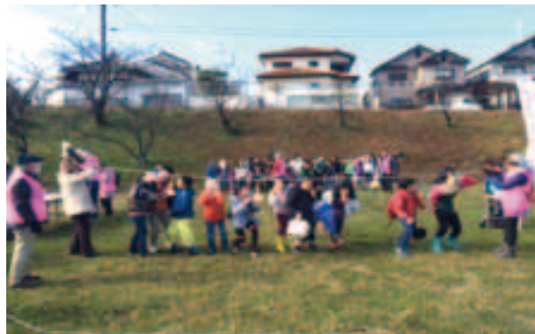
パン食い競走に興じる子ども達

平日の昼間は、中学生の力が必要です。日頃から彼らの防災意識を高めておく必要があります。