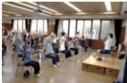
ストレッチを始める受講者