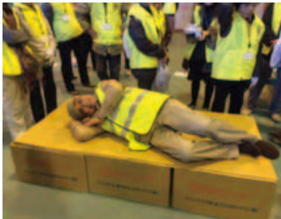
段ボール製ベッド