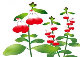
街路樹の根本に植えたチェリーセージ