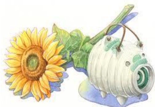
ひまわりと蚊取り線香