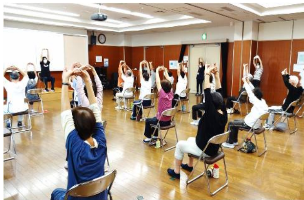
インストラクターの指導で体操開始

長い間身体を動かしてなかったので柔軟性が失われていることを実感しました。インストラクターの指導をよく理解して体操を続け、身体をより良い状態に保ち続けたいものです