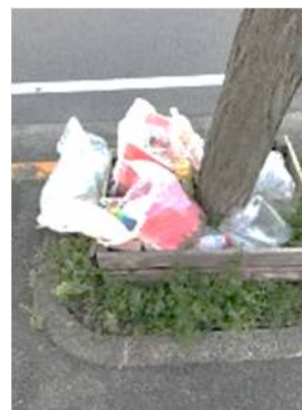
捨てる場所ではありません