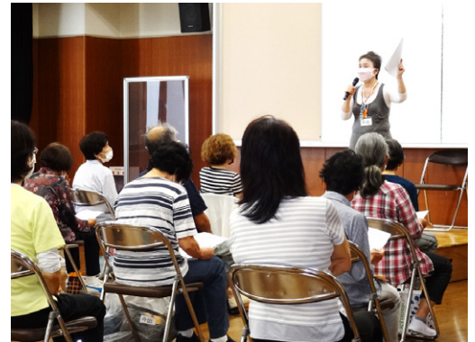
開講式(オリエンテーション)