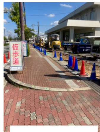
関西みらい前の工事