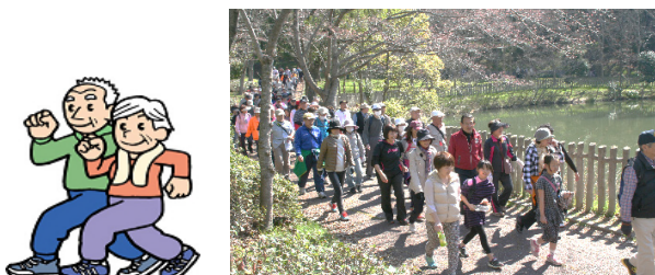
過去のウォーキング

2024 年 3 月末、第二小学校を起点として陶器山から泉北ニュータウンをめぐるコースで、準備を進めておりますのでご期待ください。