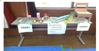
作成予定工作物の見本