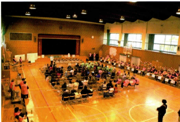
体育館に集まった人々