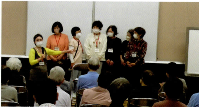
リーダーとアシスタントの皆さん。