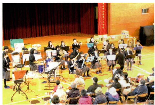
南中学校 ブラスバンド部