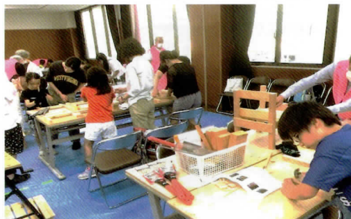
過去の親子工作教室